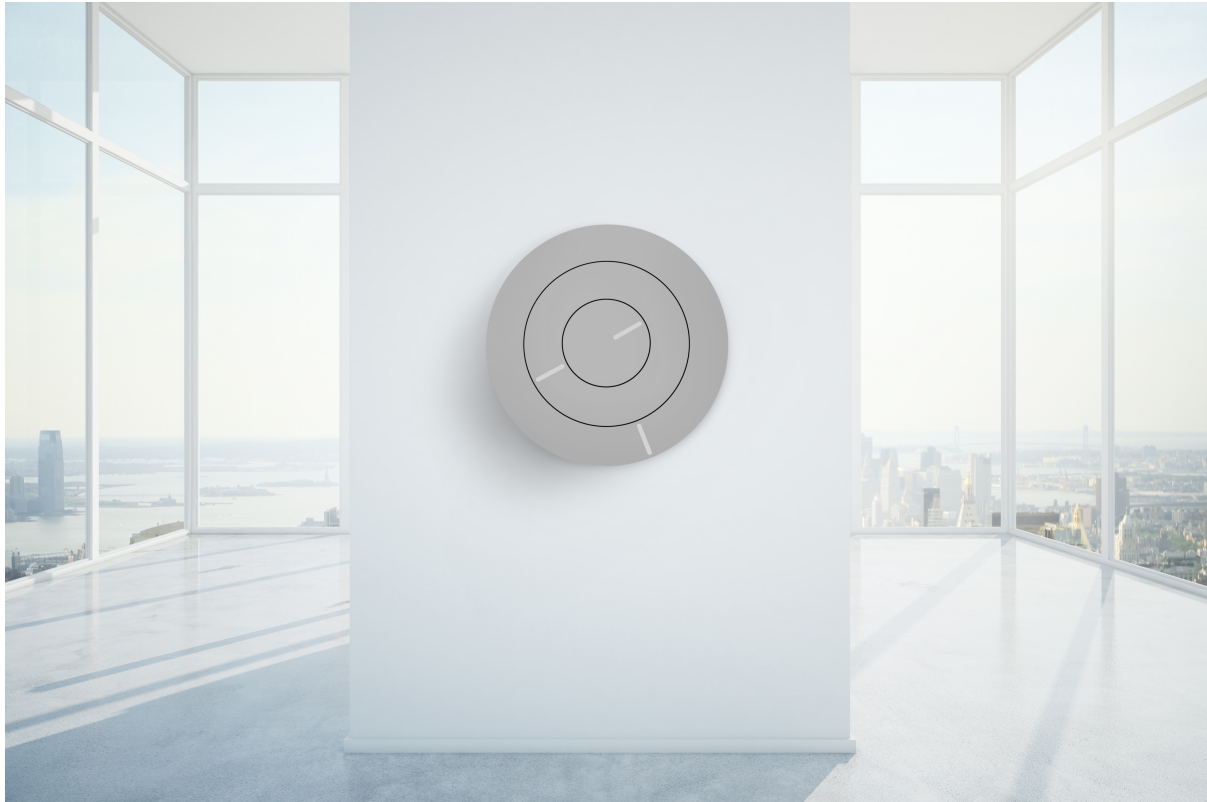
Afbeelding 1 OOCLOCK colour Beach White