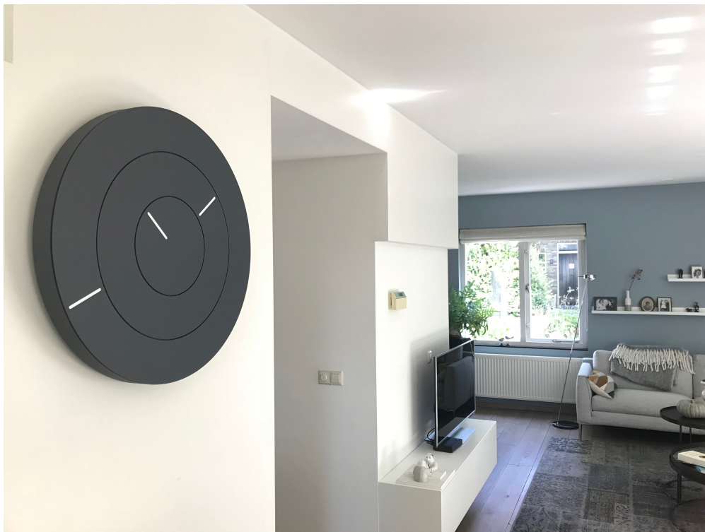
Afbeelding 4 OOCLOCK colour Midnight Grey