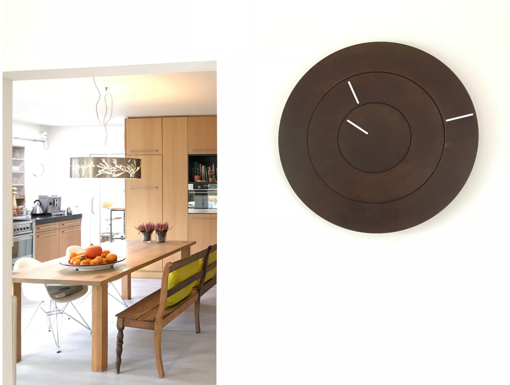
Afbeelding 3 OOCLOCK colour Rusted Corten Steel